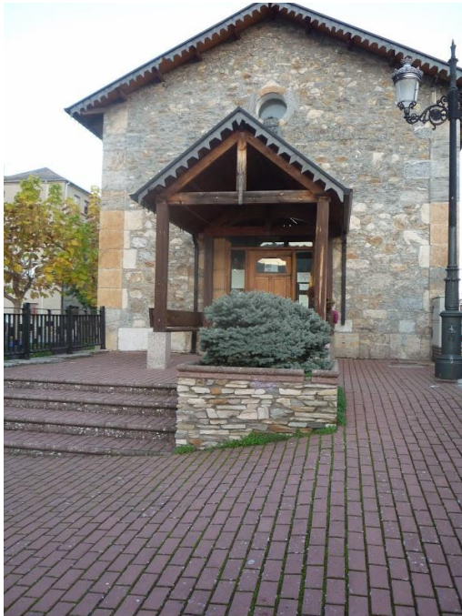
TORAL DE LOS VADOS León Biblioteca municipal