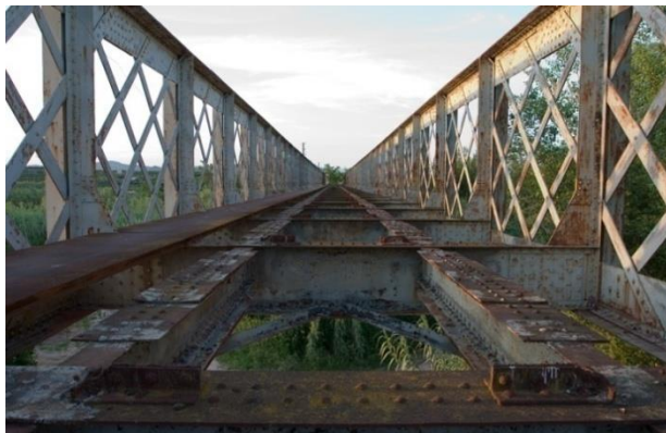
PUENTE SIN MANTENIMIENTO