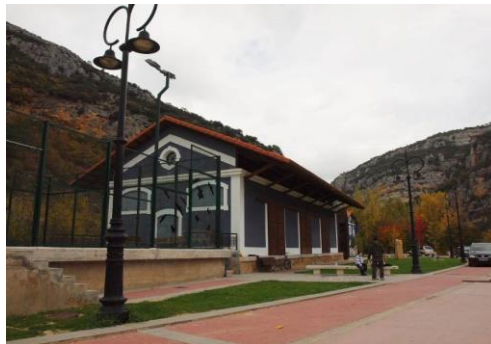
OÑA Burgos Albergue