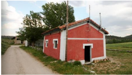
HONTORIA DEL PINAR Burgos Área de Turismo Rural